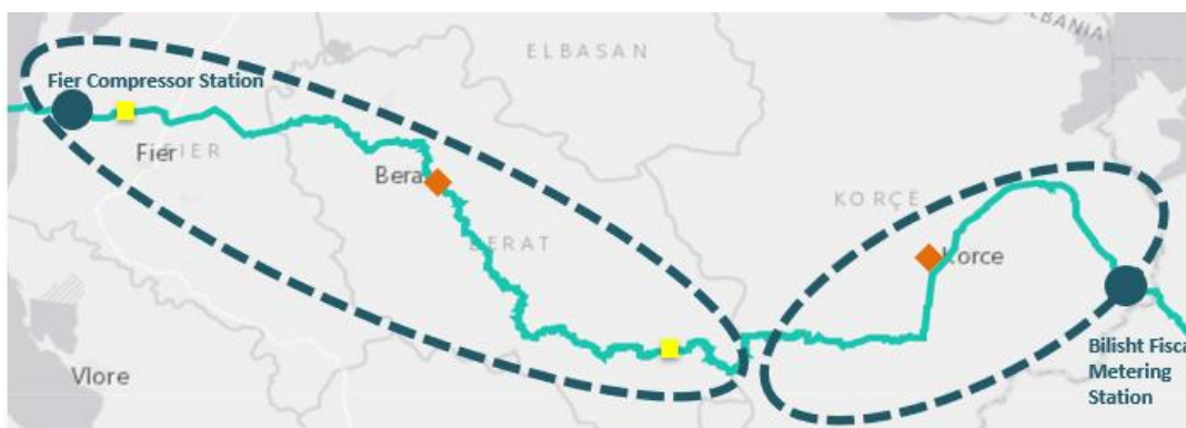
Figura 2: Ndarja e tubacionit në dy zona kryesore

Tubacioni që kalon territorin është rreth 215 km, i cili fillon nga kufijtë jug-lindorë me Greqinë dhe përfundon në bregdetin e detit Adriatik. Tubacioni përbëhet nga dy zona kryesore, zona e Korçës dhe Beratit, Çorovodës dhe Fierit.